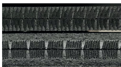
Schlitz-Steg-Muster und Scharnier